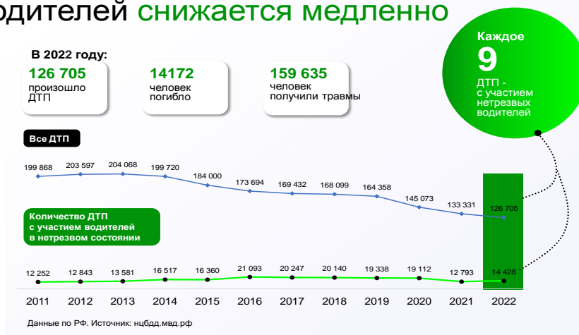
График показывает, что количество аварий на дорогах снижается – даже при росте числа автомобилей. А вот количество ДТП с участием нетрезвых водителей почти не снижается – нижняя линия в графике практически стоит на месте и временами даже приподнимается.

В 2022 году каждое девятое ДТП произошло с участием водителя в нетрезвом состоянии.