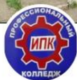
Ишимбайский профессиональный колледж

Результаты анализа оценки качества образовательной деятельности студентами Государственного бюджетного профессионального образовательного учреждения «Ишимбайский профессиональный колледж», проводимого в рамках регионального этапа профессионально-общественной аккредитации профессиональных образовательных программ: